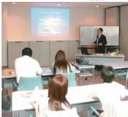
講義、デモンストレーション

靴販売店にお勤めで靴調整を始めたい方 靴関連商品開発担当者 フットケアや靴調整に興味のある方